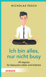
Ich bin alles, nur nicht busy