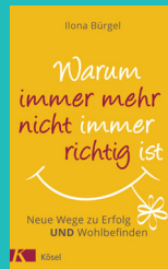
Warum immer mehr nicht immer richtig ist

Die Kapitel sind nach meinem Empfinden wirklich randvoll gefüllt mit zahlreichen Informationen, Impulsen sowie Erfahrungswerten, die das Thema greifbar machen. Demnach sollte man sich mit der Lektüre wirklich ausreichend Zeit lassen und die Inhalte eher „häppchen- und kapitelweise“ sacken lassen, damit sie ihre volle Wirkung entfalten können und nicht in der Masse der Information untergehen.